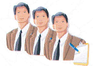
ОИВ субъектов РФ и созданные ими организации (с 01.05.2016)