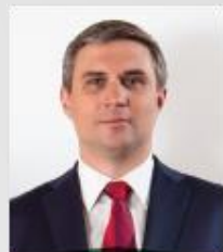
ЛЯЛЬКОВ Святослав Юрьевич

Депутат Государственной Думы Российской Федерации, член Комитета по бюджету и налогам