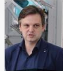
ТИТОВ Руслан Вадимович

Депутат Государственной Думы РФ, заместитель председателя Комитета по экономической политике, промышленности, инновационному развитию и предпринимательству