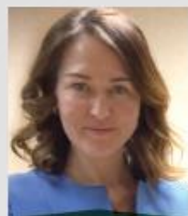
АХМЕЕВА Эльмира Ахтямовна

Депутат Государственной Думы Российской Федерации, член Центрального штаба ОНФ