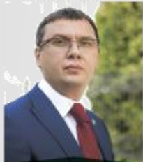
КОЛОДЯЖНЫЙ Сергей Александрович

Депутат Государственной Думы РФ, член Комитета по экономической политике, промышленности, инновационному развитию и предпринимательству